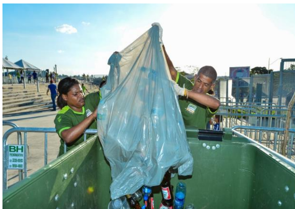
Catadores de Asmare actuando en la segregación de residuos.

El entrenamiento del equipo de recolectores, de modo que ellos entendieran las exigencias y reglas del Estadio fue el mayor desafío. Otro desafío es gestionar la logística del tamizaje y separación, pues enormes volúmenes de residuos se generan en días de partidos de fútbol y deben ser triados en un máximo de tres días, pues el residuo inicia el proceso de descomposición muy rápidamente, generando mal olor y atracción de vectores, lo que inviabiliza el proceso.