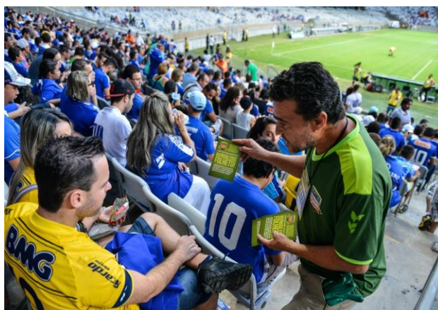
Conscientización en días de juegos en el Estadio Mineirão.