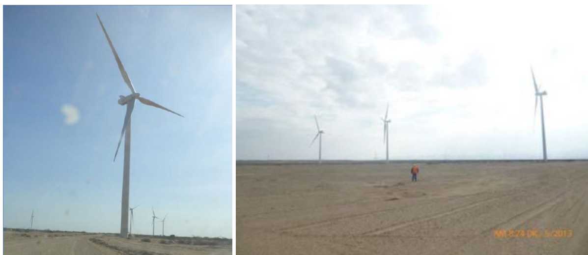
Imagens da central