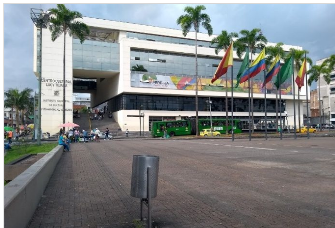
Centro Cultural Lucy Tejada.

Nesse contexto, o objetivo proposto era "abordar os problemas da população vulnerável do setor, consolidar sua vocação comercial e de serviço e recuperar a validade urbana e funcional do centro da cidade" (Vallejo de la Pava, 2010, p. 234).