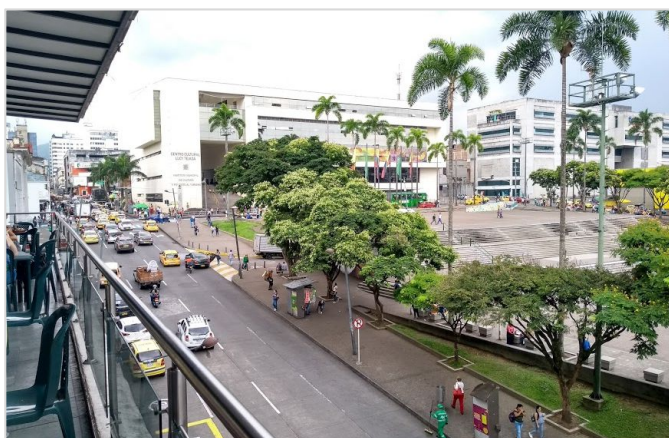
Vista do Centro Comercial Cidade Victoria