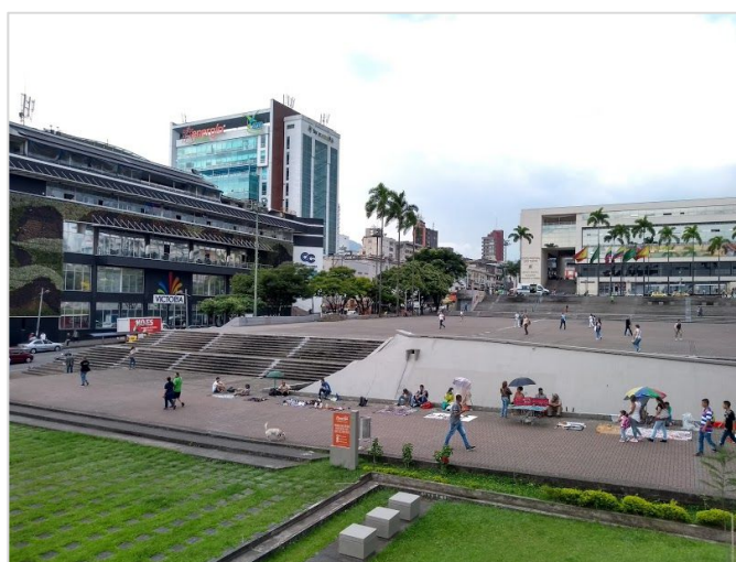
Vista da ponte de pedestres. Izq CC. Ciudad Victoria. Centro Cultural Derecho Lucy Tejada Fonte: Imagen por Laura Amaya Gallo

Outros autores, como Vallejo de la Pava, identificam outros objetivos do projeto em outros setores, tais como: política, consolidação da governança e o Plano de Ordenamento Territorial, social, melhoria da qualidade de vida e geração de