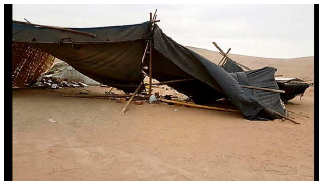
Dstrucción del proyecto.

árboles, plantas ornamentales, cultivos comerciales, plantas medicinales. Además eligieron usar técnicas de cultivo biológicas para no degradar el abono.