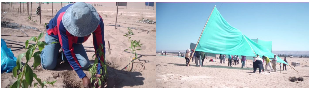
Primera fase del proyecto.