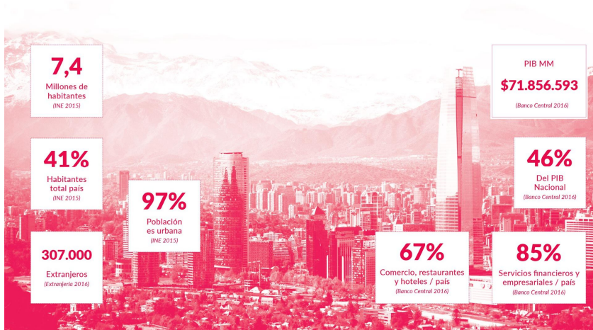
Potencial del Gran Santiago para ser una Smart City