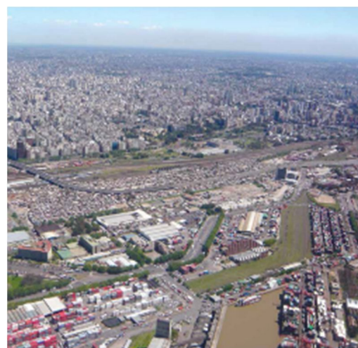
Vista aérea de las villas 31 y 31 Bis.