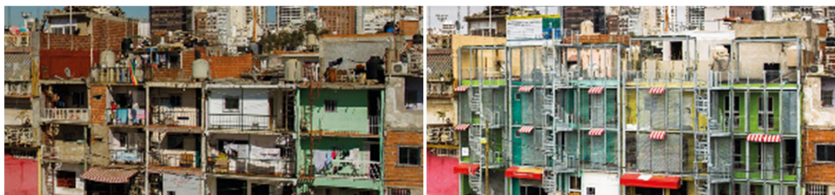
Mejoras realizadas en las viviendas del Barrio 31 y 31 Bis, proyecto, antes y después.