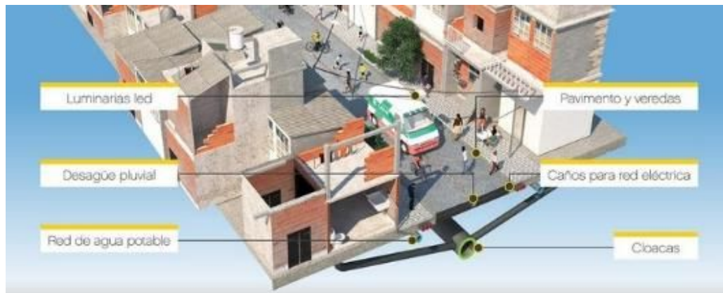
Refuncionalización de las calles, solado multipropósito.

Los espacios del proyecto serán entendidos entonces como presencias capaces de permitir y enmarcar el ejercicio de diversas prácticas, tanto en la reformulación de preexistencias históricas como a través de la incorporación de nuevas configuraciones. Las calles preexistentes, abiertas sus continuidades entre extremos del barrio, complementadas con otras por regularización de trazas incompletas o apertura en sectores de tejido "blando", garantizan una malla básica al desarrollar el sentido perpendicular norte - sur, cubriendo uniformemente el territorio actual de las villas y predios anexos complementarios de la urbanización. Estas vías en su conjunto definen la dimensión básica del espacio público, a través de un solado básico multipropósito, la disposición de luminarias, mobiliario, señalética y forestación de borde, contribuyendo al cambio de imagen general buscado. Son, ante todo, bajo su piso, el vehículo de penetración de las infraestructuras y servicios básicos. Su trazado circunscribe unidades de tejido mayores o manzanas, estableciendo el necesario deslinde legal entre lo público y lo privado, y contribuyendo además, al proceso definitorio del régimen de propiedad.