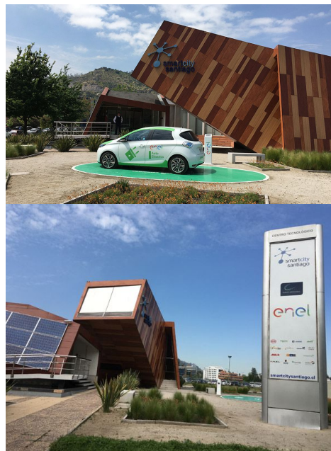
Centro Tecnológico Interactivo en Parque de Negocios Ciudad Empresarial, Huechuraba