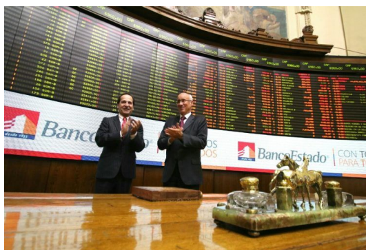
Banco Estado es el primer emisor de bono social