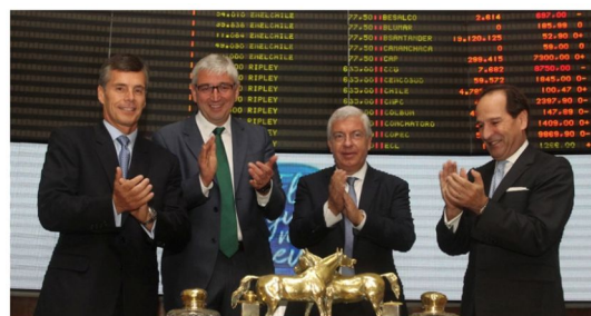
Aguas Andinas es el primer emisor de bono verde en Chile

O Banco Estado (o único banco estatal) é o primeiro a emitir um vínculo social, que está alinhado à promoção de iniciativas que reduzam as desigualdades sociais no País. Esse bônus foi de um total de US $ 83.000.000 com uma taxa de colocação de 4,25% e prazo de 4 anos para financiar projetos