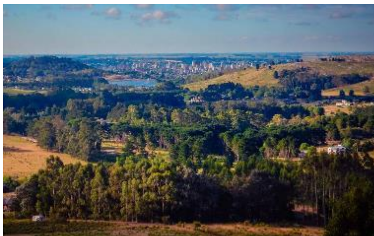
Tandil y su entorno natural.

En cuestiones de equidad, el PDT y las políticas y acciones derivadas de él, buscan promover la reducción de las desigualdades y de la exclusión social facilitando el acceso a la tierra urbana, a la vivienda, a la infraestructura urbana, al transporte y a los servicios públicos tanto para las presentes como para las futuras generaciones. Su horizonte lo guía una gestión democrática del territorio por medio de la participación de la población y de las asociaciones representativas de los diferentes sectores de la comunidad en la formulación, ejecución y seguimiento de planes, programas y proyectos de desarrollo urbano y rural. Para este objetivo el