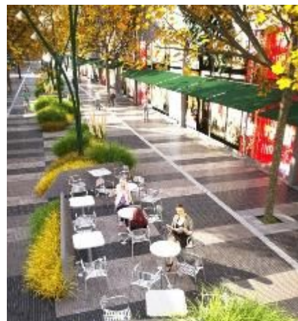
Peatonalización del Centro Comercial. Equipamiento urbano y forestación para generar una imagen propia.

O equipamento urbano tem um papel fundamental, como meio de informação e provisão de uma imagem própria do CCCA, contemplando a eliminação de barreiras arquitetônicas que dificultam a acessibilidade e utilização do espaço, e garantindo a sustentabilidade do conjunto. Os canteiros, com formas trapezoidais, referem-se à ravina e contêm gramíneas nativas típicas, portanto resistentes, na margem do rio, reforçando a identidade local.