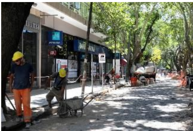
Ensanchamiento de veredas.

Até agora, só houve progresso com a renovação das calçadas do shopping ao ar livre de San Isidro. O trabalho foi realizado em quatro etapas, contemplando cerca de 15.000 m 2