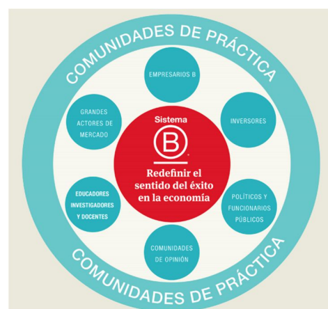
Sistema B

O Movimento B acontece a nível global; que começou com o interesse de empresários e PMEs interessados em se tornarem certificados como empresas B. Grandes empresas também foram integradas como, por exemplo, Natura, Danone e Hortifrut. Por outro lado, existem empresas que não estão no sistema, como o Parque Arauco e o Mall Plaza, mas que utilizam o programa (ferramentas gratuitas e online) para avaliar seus fornecedores e elevar o padrão da cadeia de valor. A primeira empresa na América Latina a ser certificada no Sistema B foi a empresa chilena TriCiclos em 2012, ano de início do sistema na América Latina.