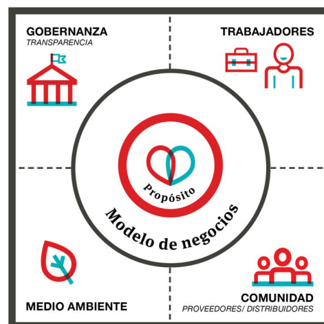
Áreas evaluadas para medir el impacto/ Fuente: www.sistemab.org