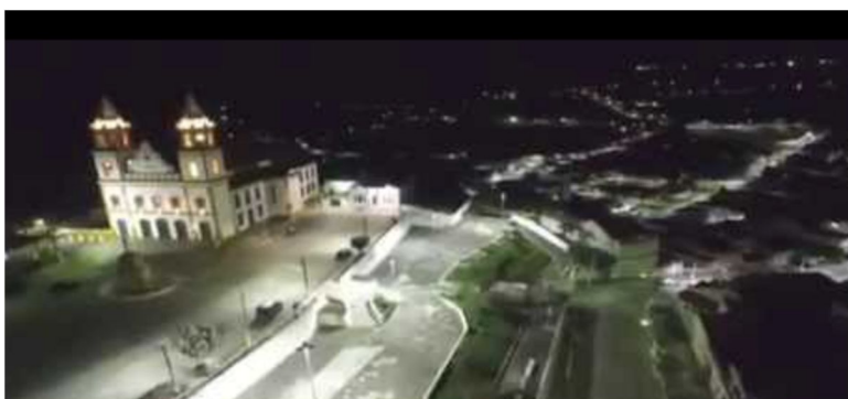
Igreja matriz de Bananeiras/PB.

O projeto surgiu em função da necessidade de reduzir o consumo energético do município e buscar soluções para que essa redução também possibilitasse benefícios diretos para os empreendedores locais, repercutindo nas finanças públicas e com reflexos positivos na seara ambiental e no setor privado. A proposta se aproxima das necessidades da atualidade, as ações de sustentabilidade e a busca pela eficiência no consumo energético devem estar na pauta dos gestores e dos empreendedores, posto que essas são temáticas globais. O intuito maior é transformar Bananeiras em referência em ações de sustentabilidade e eficiência energética, dando visibilidade ao Município e atraindo mais investimentos, sobretudo os ambientalmente corretos.