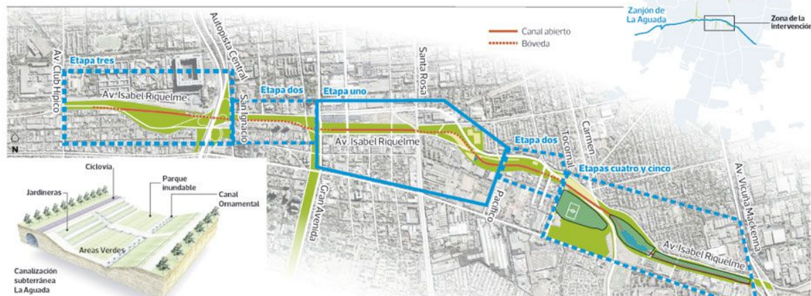
Etapas da várzea Víctor Jara / Fonte: Ministério das Obras Públicas (MOP)

Proporciona segurança contra inundações e transbordamentos, bem como um espaço público que melhorará a qualidade de vida dos vizinhos. Um lugar de lazer, que servirá para realizar eventos culturais, sociais e esportivos, especialmente na esplanada onde está localizado o mural da "árvore Víctor", um dos maiores do Chile, com 53m de comprimento e 1563m 2 de tinta, que é uma homenagem ao cantor e compositor Víctor Jara e executada por muralistas e grafiteiros do Museu ao Ar Livre da Comuna de San Miguel. A manutenção deste parque ficará a cargo do Parquemet.