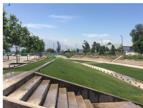
Vista pedestre da várzea / Fonte: MOP