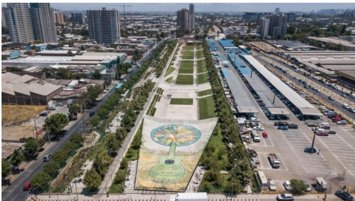
Vista aérea da Várzea - Fase 1