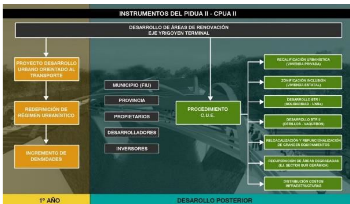
Esquema de gestão do projeto. Plano Diretor do Eixo da Integração do PIDUA II, Município de Salta.

Mesmo com as limitações descritas em termos de implementação efetiva do projeto, a formulação, o consenso e o processo de comunicação do projeto alcançaram efeitos notáveis, como os seguintes: