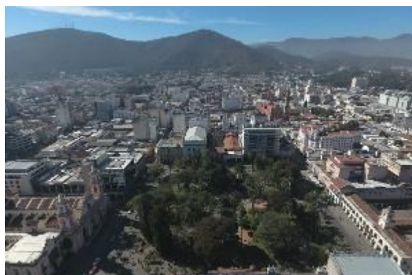
Imagem da cidade de Salta e seu entorno.

O projeto "Eixo de Integração" foi concebido como um dos "Temas Geradores" ou "Projetos Disparadores" do II Plano Integral de Desenvolvimento Urbano (PIDUA II) da cidade de Salta, formulado entre 2012 e 2015, e localizado no primeiro nível de avaliação e priorização do referido Plano. Centra-se no flanco oriental da cidade de Salta e Nordeste da Região Metropolitana do vale de Lerma. Baseia-se no princípio do "Desenvolvimento Urbano orientado para o transporte" e procura materializar-se através de um modelo de gestão intersectorial, que articula diferentes jurisdições do Estado e inclui oportunidades mistas de ação público-privada. Esta proposta é totalmente consistente com os princípios de reversão das atuais tendências expansivas no desenvolvimento urbano e seu redirecionamento para um modelo compacto e sustentável.