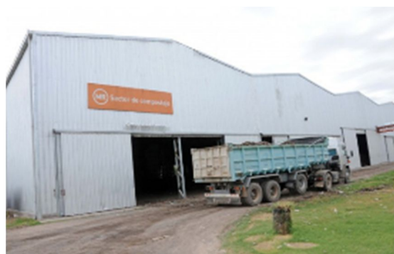
Pavilhão de tratamento de orgânicos.

Ela está localizado em uma área de 35 hectares e as instalações da usina ocupam um total de 4 hectares, tendo uma área coberta para processamento e tratamento de resíduos de pouco mais de 5.000 m 2 . Eles são compostos por dois pavilhões de estrutura metálica, o equipamento necessário para o seu funcionamento e dependências auxiliares. Possui também uma sala polivalente (SUM) para desenvolver atividades relacionadas à disseminação e comunicação do gerenciamento de resíduos. Nessas atividades, escolas, entidades públicas e privadas, vizinhas e moradores participam do marco dos diferentes programas de educação ambiental promovidos pelo município. Esta estação demonstra o comprometimento do município em atingir as metas propostas na Portaria Zero Resíduos.