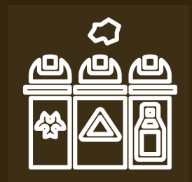
GESTÃO DE RESÍDUOS

CASO: Planta de Tratamento e Valorização de Resíduos de Bella Vista PAÍS: Argentina CIDADE: Rosario POPULAÇÃO: 948.312