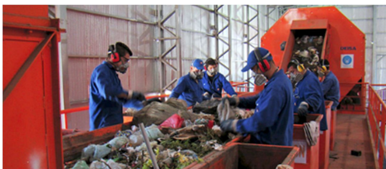
Esteira de recuperação de recicláveis.

Ela está localizado em uma área de 35 hectares e as instalações da usina ocupam um total de 4 hectares, tendo uma área coberta para processamento e tratamento de resíduos de pouco mais de 5.000 m 2 . Eles são compostos por dois pavilhões de estrutura metálica, o equipamento necessário para o seu funcionamento e dependências auxiliares. Possui também uma sala polivalente (SUM) para desenvolver atividades relacionadas à disseminação e comunicação do gerenciamento de resíduos. Nessas atividades, escolas, entidades públicas e privadas, vizinhas e moradores participam do marco dos diferentes programas de educação ambiental promovidos pelo município. Esta estação demonstra o comprometimento do município em atingir as metas propostas na Portaria Zero Resíduos.