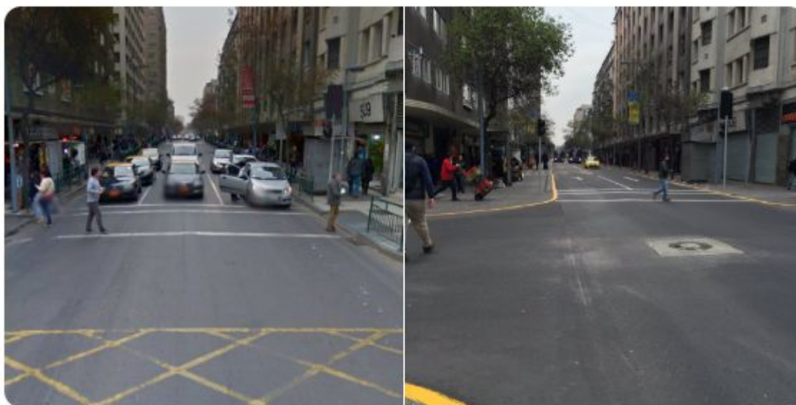
Plan Centro: calle San Antonio antes y después de la remodelación.