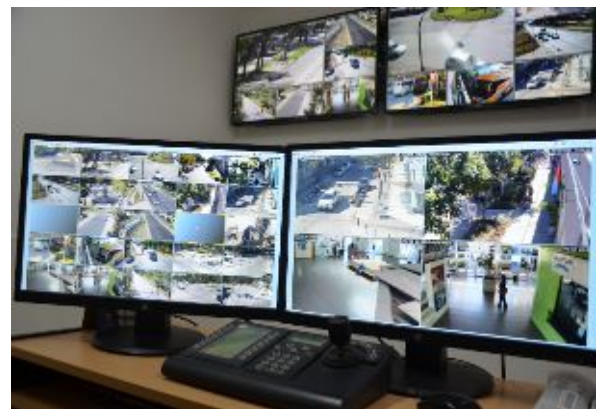
Centro de Operações Estratégicas (CEO)

Centro de Operações Estratégicas (CEO): Agência de segurança urbana. Vigilância por vídeo e sistema de monitoramento de fibra óptica: 25 câmeras operando 24 horas por dia em diferentes partes da cidade, integradas ao serviço de emergência 911. Este sistema é único na região, trabalhando em conjunto com as forças de segurança, sendo um grande passo para a prevenção e segurança dos cidadãos.