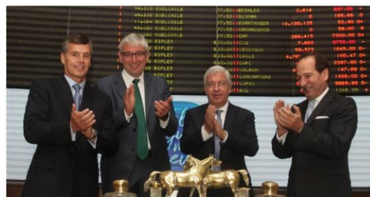
Aguas Andinas es el primer emisor de bono verde en Chile

O Banco Estado (o único banco estatal) é o primeiro a emitir um vínculo social, que está alinhado à promoção de iniciativas que reduzam as desigualdades sociais no País. Esse bônus foi de um total de US $ 83.000.000 com uma taxa de colocação de 4,25% e prazo de 4 anos para financiar projetos