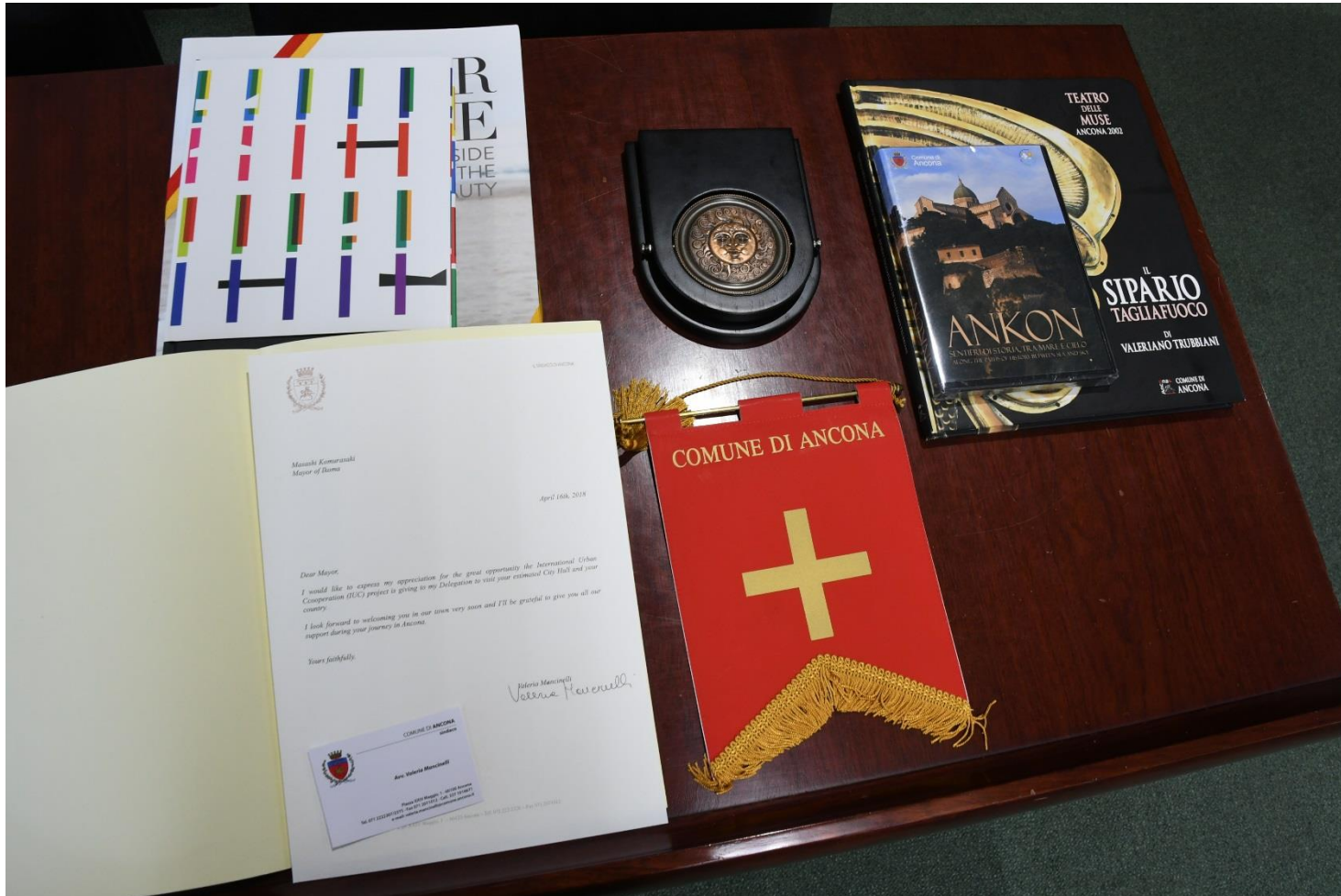
アンコーナ市長からの親書及び贈答品。